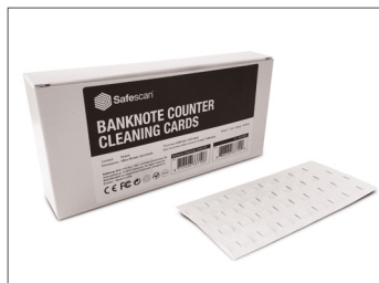
Karty czyszczące Safescan Nr art.: 152-0663