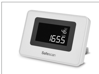
Wyświetlacz zewnętrzny Safescan ED-160 Nr art.: 112-0663