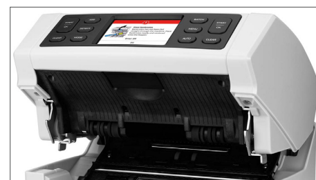
Wewnętrzne części i czujniki można łatwo oczyścić, otwierając panel górny