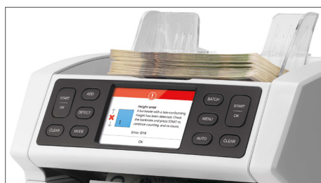
Wyświetla szczegółowy komunikat po wykryciu podejrzanego banknotu