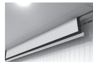
Ideal für Decken- oder Wandmontage